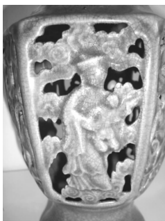
图6 六方瓶瓶身唐僧纹