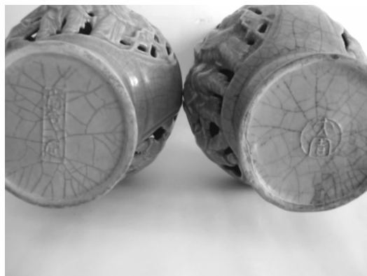
图4 卣底款识分别为“尚食局”和“大周”