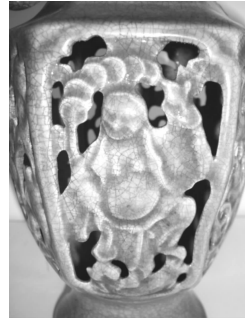
图8 六方瓶瓶身八戒纹