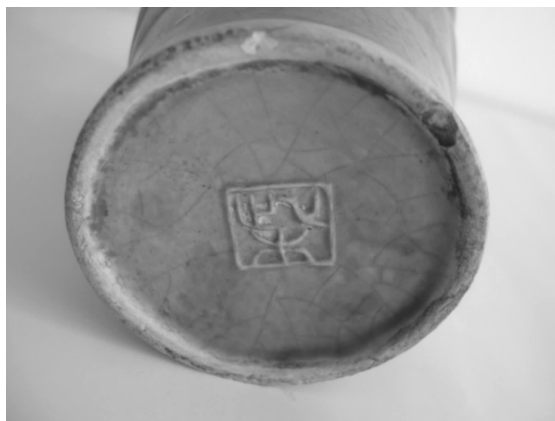
图 2 净瓶底单方框内篆体“柴”字款