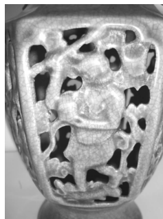
图7 六方瓶瓶身悟空纹