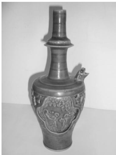
图 1 净瓶