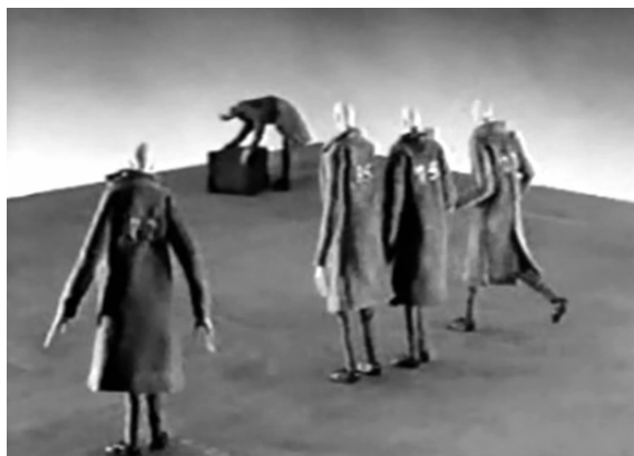
图 3 《平衡》

在动画短片中,独特的造型语言与多样化的艺术风格及表现方式显得尤为重要。简约型动画角色外形高度简练、其个性化与概括性的艺术特征与动画短片的艺术诉求相吻合,将更有利于强化动画短片艺术风格的表现。例如,加拿大著名动画短片《摇椅》(图 4)中,速写式的线条人物形象与简练的淡彩风格场景相得益彰,浑然一体,再配上欢快的背景音乐,将田园风格的视觉美感与民族舞蹈的酣畅淋漓发挥到了极致,其艺术高度是其他动画短片很难超越的 [2] 。