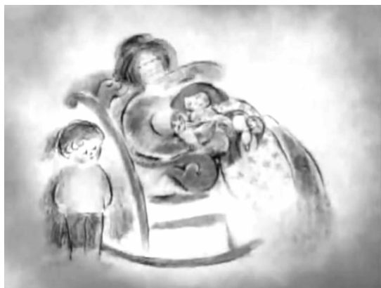
图 4 《摇椅》