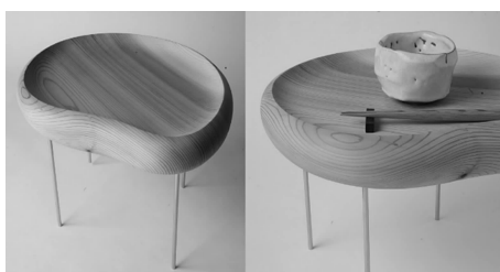
图10 SOBAN SUGI 杉木桌 Fig. 10 SOBAN SUGI table