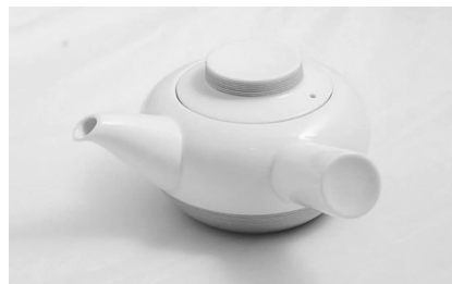
图12 白山陶茶壶 Fig. 12 Pottery teapot