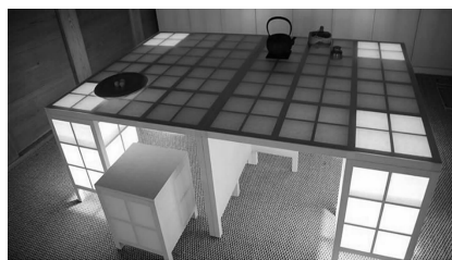
图11 黑川雅之设计的萤-BETWEEN Fig. 11 Firefly-BETWEEN designed by Masayuki Kurokawa

日本文化将外来文化兼容并蓄、吸收转化成带有明显的感性色彩的“和”文化 [5] 。也正因如此,日本