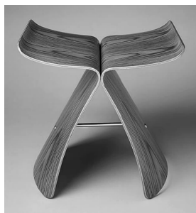
图4 柳宗理设计的蝴蝶凳