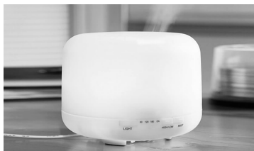
图2 无印良品加湿器

外在的“简”,通过内在的“质”提升,在用材方面首选环保天然材料,其次是再生材料,以减少材料对人体的危害和环境的污染。如图3,这款无印良品第三届设计竞赛的作品,用天然的麦秆作为吸管的材质,既健康又能够通过自然降解来减少吸管使用后对环境的影响。