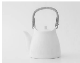
图 7 柳宗理设计的藤把手水壶

如图 8,喜多俊之于 1971 年设计的 TAKO 灯,灯的形式和结构都很简单,灯罩用日本岐阜县美浓传统手工制作的和纸为材料,保留自然纤维在造纸过程中所形成的纸质不均匀分布的状态,由此产生柔和光效及浓淡不匀的透光性,从而形成雅致的简素美。灯的形式单纯到上下两个短轴连接特质的和纸,外加光源。灯的韵味和气质完全由纸的特殊质地来决定,亮灯后就形成了雅而不俗的格调。这不是工业化的材料所能产生的产品的张力,透过和纸你能够触摸到背后的日本审美及文化中的素朴的情怀。