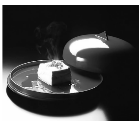
图9 轮岛漆餐具 Fig. 9 Wajima lacquer tableware

这是日本传统的“幽玄”审美 [2]91 的体现,反映的是一种超脱的心境,物品中隐而不露的余情,焕发着岁月沉积的痕迹和手作的印迹,以一种气质的形式隐于物品之中。把物料本身的变化,以及匠人制作产品的痕迹,即“手感”,作为匠人和物品、匠人和使用者、物品和使用者之间的情感纽带,通过自然的痕迹与手作印迹赋予产品予技艺灵魂 [4] ,成为产品的精神内涵。这是日本文化,也是简素设计不简的基础。强调材料本身和制作过程的价值,视手作的印迹比外表光滑、精美更为重要。让产品成为有故事的产品,简素设计因这些故事而变得丰满。如图10黑川雅之构思,由马晋平制作的 SOBAN SUGI 杉木桌,把杉木的纹理变化,木头年轮及制作中手工打磨的印迹都通过茶几而表现出来,延伸茶几的内在品质。