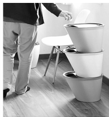
图 5 SORRISO 垃圾桶

从生活的小细节构思,解决人们实际生活需要。如图 5,SORRISO 的垃圾桶设计,考虑了垃圾分类状况下的多个垃圾桶的空间布置问题,用叠加的方式,使得小空间可以整合多个垃圾桶,并且方便家庭使用。还有深泽直人的雨伞伞柄(图 6)的设计,通过伞柄上的一个凹槽方便使用者挂放物件,扩展了伞的用途。