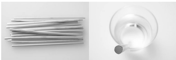
图3 无印良品第三届设计竞赛获奖作品麦秆吸管