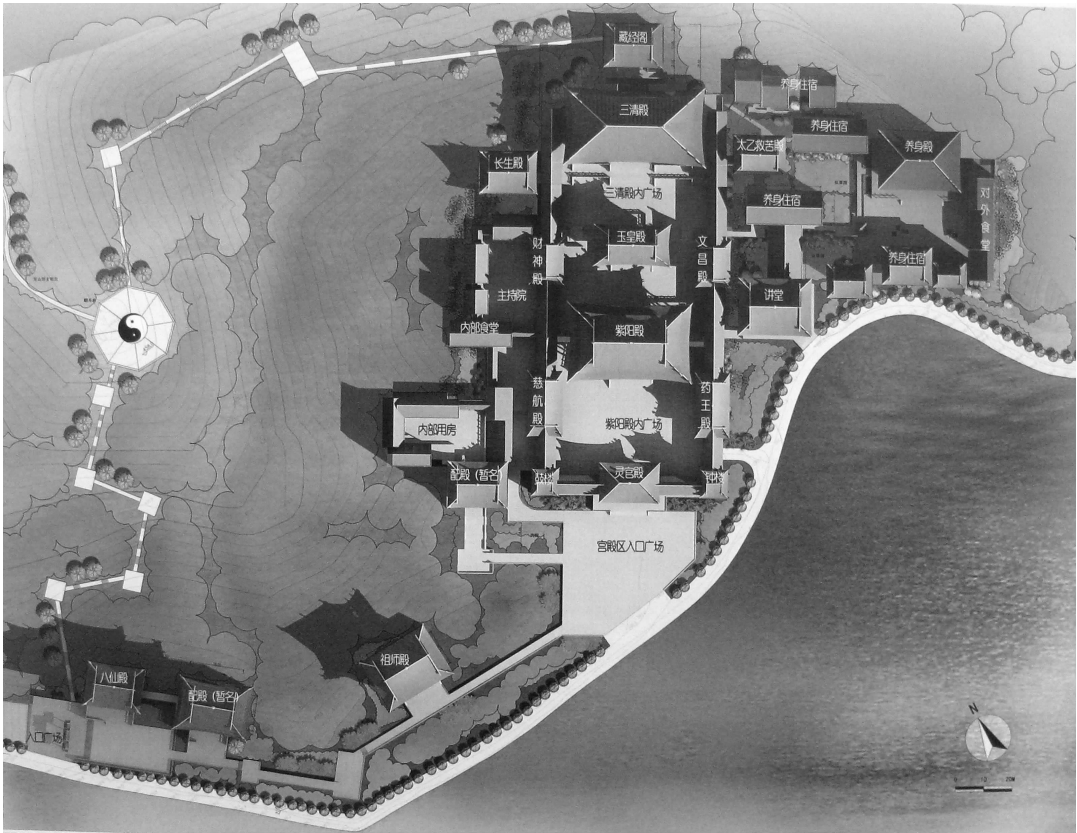
图 2 桐柏宫规划设计图

桐柏宫的复建任重而道远,既要考虑名山名景的依托,又要考虑道教文化与山水文化的融合;既要考虑出行便利的交通条件,又要考虑对自然环境的最少干预;既要考虑养生修炼场境,又要考虑理想的山水环境;既要考虑有足够的发展空间,以便与中国道教金丹派南宗祖庭相匹配,又要考虑对整个天台山旅游的影响,使其融入天台山旅游网络中,等等。2007 年 11 月,上海润清建筑设计事务所为桐柏宫的修建做了总体规划和设计(图 2、图 3)。2010 年 7 月,桐柏宫正式开工修建,在确定其修建地址时,综合考虑了各