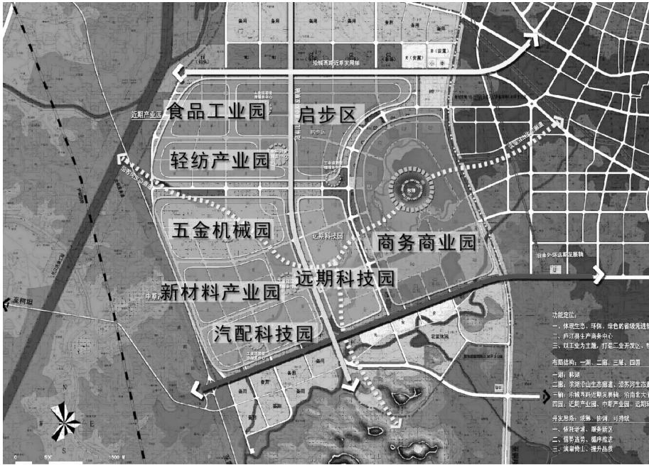
图 3 安徽庐江经济开发区总体规划(城西新区)功能分析图

滨湖设置景观性的环湖一路,湖中建堤、曲幽起伏;环湖建设生活性的环湖二路和环湖南路,路桥合一、步移景异;外围工业区内则以交通性道路为主,现代景观、宽敞大方。整体采取环状放射与棋盘状相结合的道路系统:工业园内道路简洁通达,方便工业用地划分;中心区内环湖放射,提高中心区通达性。使道路形式与设计功能相吻合(图 3)。