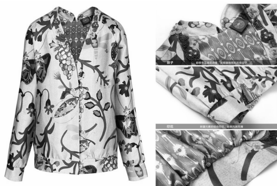
图7 艾特莱斯花纹里衬夹克

新疆维吾尔族传统民族服饰元素的融入,让现代服饰与哈密维吾尔族刺绣融合得更为恰如其分:如独具西域风情的艾特莱斯花纹面料,设计师将这种面料作为衬里应用于夹克的设计(图7),艾特莱斯花纹与具有新疆特色的植物印花相映成趣;还运用了维吾尔族民族服装裁剪方式,比如把维吾尔族男装中的袷袂服饰融入到外套和大衣的设计中;在整体服装搭配造型中(图8),以哈密风景为背景,加入了维吾尔族花帽、长辫等具有地域特色的配饰元素,与运动风格进行混搭,强调了作品整体的民族风情,但也不乏年轻的时髦感觉。