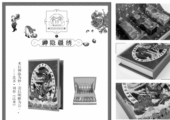
图9 哈密维吾尔族刺绣手包

以“密扇”品牌为例,专门开辟“密扇手作”系列,主推与哈密维吾尔族刺绣相关的服饰产品。在产品的说明中,加入了哈密维吾尔族刺绣的文字介绍,让消费者了解到服饰背后的文化“基因”,对这项非物质文化遗产也起到宣传效应。标牌设计采用维吾尔族服饰中具有代表性的红、绿、白、黑四色,结合传统刺