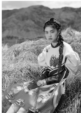
图8 维吾尔族风格的服装造型