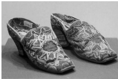
图3 维吾尔族女士刺绣高跟鞋

Fig. 2 Uyghur waistcoat with golden couching stitch