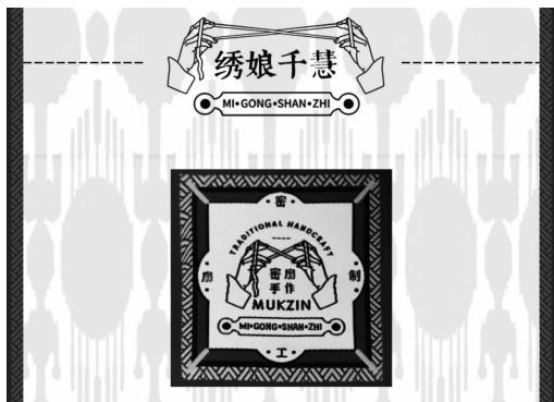
图 10 “密扇手作”系列标牌

绣图案中的几何形纹样,以对称的手形图案强调手工刺绣的概念(图 10)。该系列还在每件服饰产品的领标设计中加入了刺绣者的姓名,分别以汉语和维语书写,并用不同的色彩加以区分,把每件产品都作为绣娘们精心制作的艺术品来推广(图 11)。该系列在上海东方卫视电视台主办的《我的新衣》节目中呈现在大众面前,设计师携手哈密绣娘传达出这项非物质文化遗产的独特美感,掀起了关注的热潮。产品推出一季后总订单量达到七十多万件,销售额达三十多万元,消费者年龄层集中在 25 岁至 35 岁之间,证明这项非物质文化遗产已被年轻消费者接受。合作两年来,该系列产品的订单量仍在持续增加中。通过网络媒体、明星效应、时尚活动、电视媒体、文化传媒公司等传播媒介的共同努力,新疆哈密维吾尔族刺绣的非物质文化遗产传承项目受到持续关注。