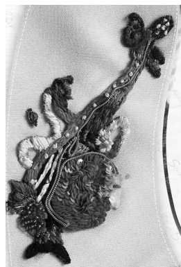
图6 艾捷克图案刺绣