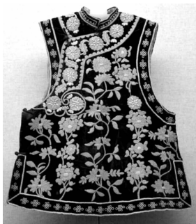
图2 维吾尔族平金绣马甲

Fig. 1 Red ground triangle wool embroidery fragments