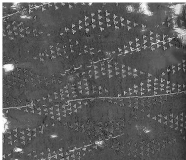
图1 红地三角纹毛绣残片

新疆地区的刺绣始于汉朝,盛于唐、清,至今仍保留着多种刺绣类型 [4] 。而自古被誉为“西域襟喉”的哈密地区,赋予了维吾尔族刺绣独特的历史文化、风格表象以及蕴含其中的民族情谊。1978年在哈密五堡22号墓考古中发现的毛绣残片(图1),属于距今3200多年前青铜时代晚期的陪葬品,是国内目前发现最早的毛绣品,其表面为组织结构较为疏松的平纹结构,以织一梭绣一针的方式,表现出规整的三角形纹样 [5] ,显示出史前时期新疆毛绣技术的精湛技艺,记录了该地区原生刺绣文化的初始。东汉《后汉书·西域传》:“伊吾地宜五谷、桑麻、蒲萄”,记录了桑蚕业从内地传入哈密的情境,带动了该地区刺绣产业的发展。康熙三十八年(1699年),新疆哈密扎萨克和硕亲王额贝都拉喜爱苏绣和京绣的华丽精美,邀请绣娘传授刺绣技艺,丰富了维吾尔族刺绣的针法和表现形式 [6] 。如维吾尔族镶边平金绣花卉纹黑绒女马甲(图2),借鉴苏绣中的平金绣工艺,袖口和衣边被精致的如意纹样包围,通过华丽和饱满的花卉图案展现出维吾尔族先辈对生命的热爱;维吾尔族女士刺绣高跟鞋(图3),以艳丽的色彩搭配,满花的构图形式,以辫绣突显立体感,展现出热情奔放的审美特质。由此可见,哈密维吾尔族传统刺绣既保留着本民族的个性,也呈现出汉文化中的纹样符号(如蝙蝠、如意、卷云纹和各种汉文字) [7] ,同时还融合了苏绣的刺绣工艺,这是研究丝绸之路刺绣文化交流的重要依据。